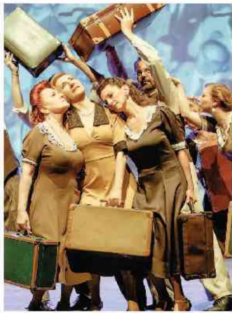
● Una scena dello spettacolo

N EL MUSEO del campo di concentramento nazista di Auschwitz, in Polonia, un immenso mucchio di valigie vuote e accatastate una sull'altra rappresenta la confisca dei beni personali alle migliaia di deportati ebrei. Ma la valigia può aver anche un altro significato, positivo, come quello del ritorno a casa, della salvezza, di tanti scampati all'Olocausto. «Le valigie del nonsense. Resilienza e Shoah, ridere per sopravvivere» è il titolo dell'installazione al Polo del '900, in via del Carmine 14, visibile da lunedì 5 febbraio e sino all'11 marzo. Su quattro pile di vecchie valigie, ne viene posata una aperta, contenente uno schermo su cui sono proiettate, a ciclo continuo, testimonianze di diverse persone che raccontano in ebraico, yiddish, italiano, spagnolo e francese, battute, storielle e tradizionali witz. Gli ebrei di tutto il mondo ridono di se stessi, degli altri, del passato e un po' anche del futuro. L'opera artistica è del fotografo, produttore e sceneggiatore colombiano Thierry Forte, che ha voluto rappre-