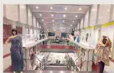
● «I love it» al Circolo del Design

sul calendario scrivendo a comunicazione@cna-to.it; www.cna-to.it. RITUALI ALL'ACQUA DELLE DOLOMITI. A Torino, in piazza Muzio Scevola 2 (nel contesto del Royal Club) c'è una piccola ma raffinata Spa votata alla cosmesi e idratazione «ad alta quota». Qui, si utilizzano i prodotti Dolomitic Water; nati dal connubio di acqua dolomitica (scaturisce dalla fonte di San Martino di Castrozza) e porfido del Trentino. Senza conservanti,