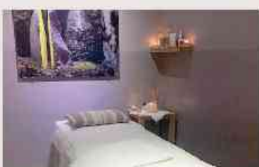
● Dolomitic Water Wellness Corner